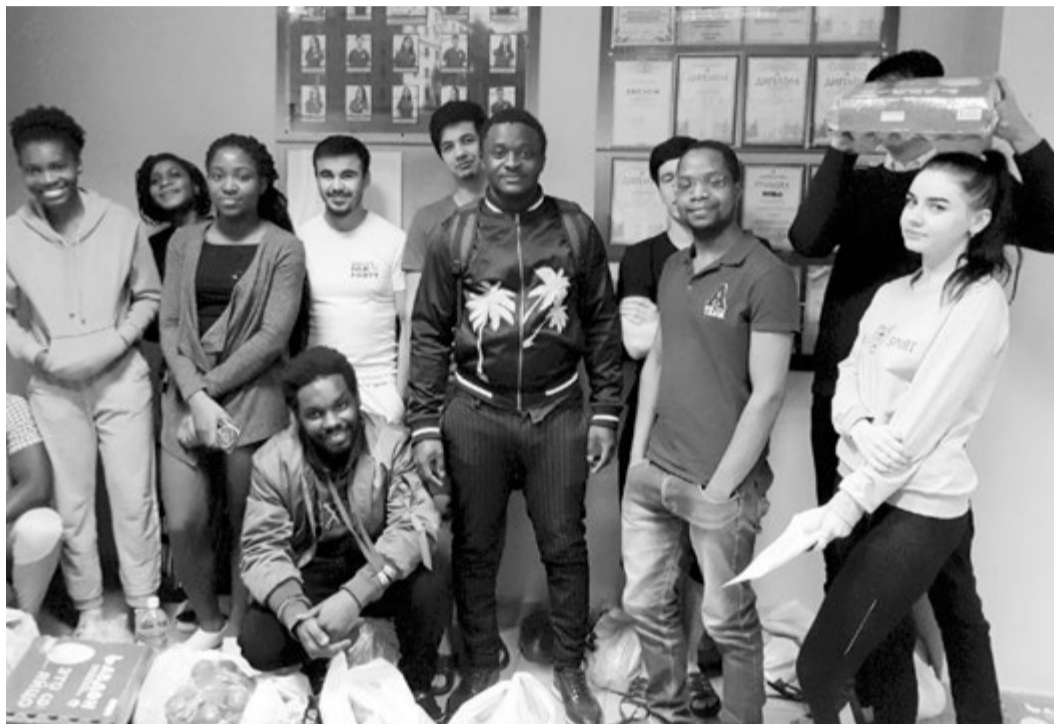
Волонтеры доставили продукты иностранным студентам УГНТУ