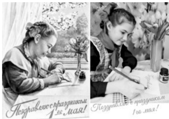
Автор - воспитатель детского сада №47 Приволжского района Казани Гульназ ВАФИНА